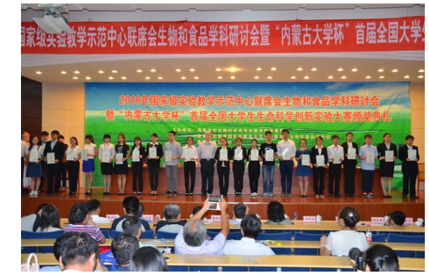
大赛二等奖获得者合影留念