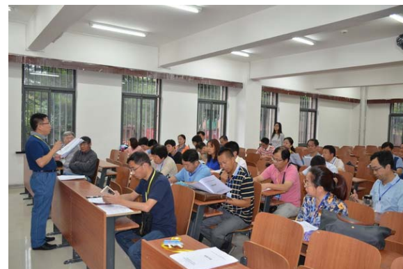
讲解大赛评分细则及注意事项