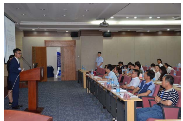
参赛选手决赛公开答辩风采