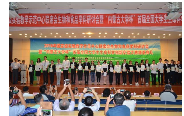
大赛优秀组织奖获得者合影留念