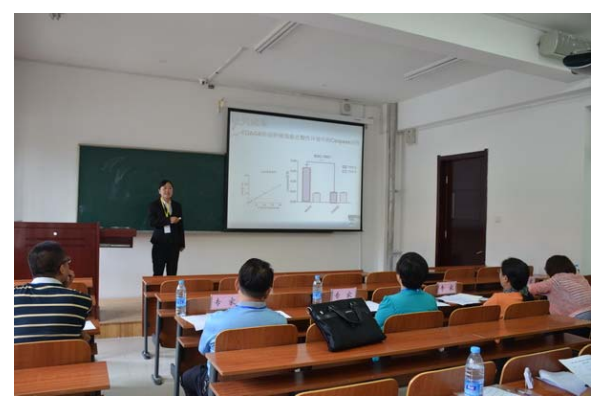
我校参赛选手初赛风采