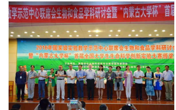
优秀指导教师奖获得者合影留念