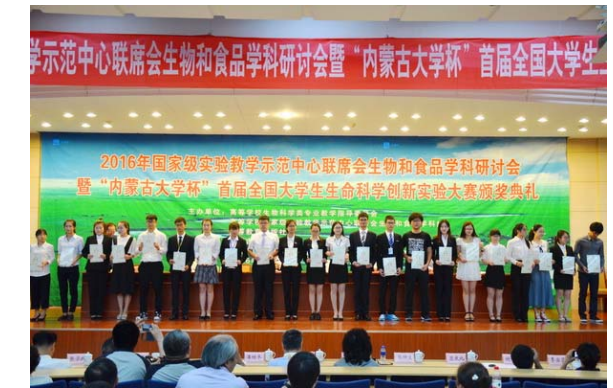
大赛三等奖获得者合影留念